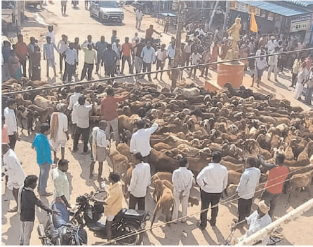
దొడ్డిబాద్, అక్టోబర్ 05, మనం న్యూస్: గొల్ల కురుమలకు ప్రభుత్వం రెండో విడత కింద గొర్రెల యూనిట్లు పంపిణీ చేయనుంది. ఈ మేరకు 36 మంది