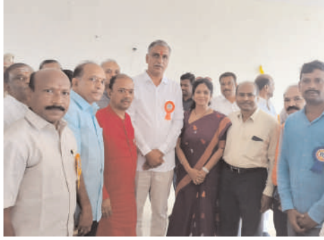
వెల్ నెస్ యోగా సెంటర్ లో