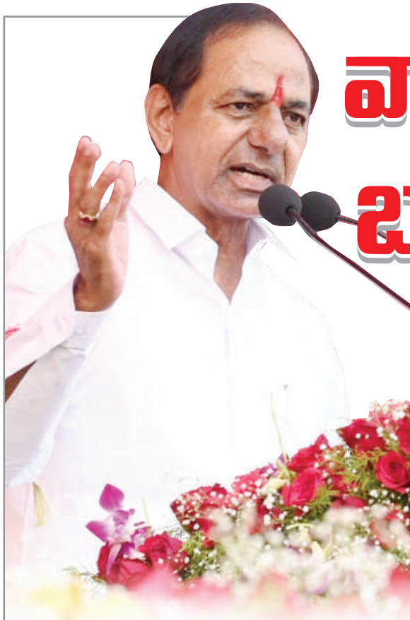
తుంగుర్తి, అక్టోబర్ 29 (మనం న్యూస్):