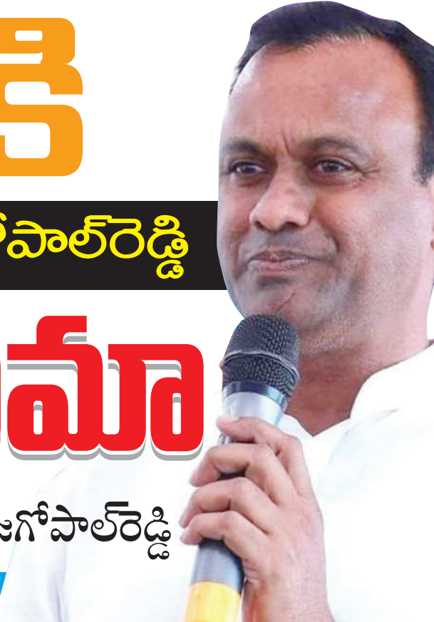
మొయినాబాద్, అక్టోబర్ 25 (మనం న్యూస్):

27న రాహుల్ గాంధీ సమక్షంలో కాంగ్రెస్ లో చేరనున్నట్లు ప్రకటన కోమటిరెడ్డి రాజగోపాల్ రెడ్డి