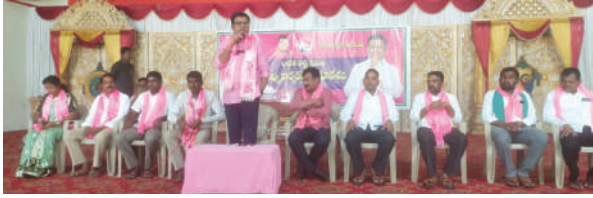
బిఆర్ఎస్ పార్టీ అమలు చేస్తున్న సంక్షేమ పథకాల గురించి ప్రకారం చేయాలని ఆయన కార్యకర్తలకు సూచించారు. ఇప్పటివరకు జరిగిన రెండు సర్వేలలో బిఆర్ఎస్ పార్టీ గెలుపొందుతుందని తెలిపారన్నారు.