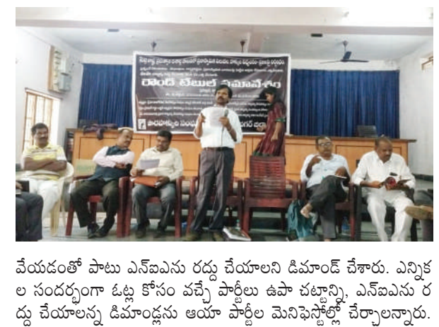
వేయడంతో పాటు ఎన్ఏపిపై రద్దు చేయాలని డిమాండ్ చేశారు. ఎన్నికల సందర్భంగా ఓట్ల కోసం వచ్చే పార్టీలు ఉపా చట్టాన్ని ఎన్ఏపిపై సర దు చేయాలన్న డిమాండ్లను ఆయా పార్టీల మెన్బెర్స్లో చేర్చాలన్నారు.