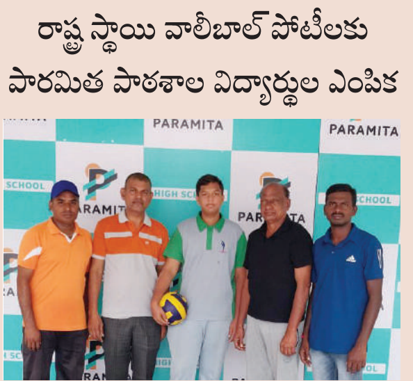
రాష్ట్ర స్థాయి వాలీబాల్ పోటీలకు పాఠశాల పాఠశాల విద్యార్థుల ఎంపిక