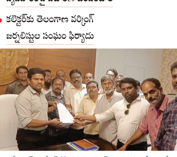
కరీంనగర్, అక్టోబర్ 10, (మనం న్యూస్): జర్నలిస్టుల పేరిట కరీంనగర్ లో పంపిణీ చేసిన డబుల్ టెక్ రూమ్ పట్టాల్లో పెద్ద ఎత్తున అవకతవ కలు చోటు చేసుకున్నాయని, అనేక అక్రమాల జరిగాయని తెలంగాణ రాష్ట్ర వర్సిఫై జర్నలిస్టుల సంఘం కరీంనగర్ జిల్లా శాఖ ఆరోపించింది.

● కలెక్టర్ కు తెలంగాణ వర్సిఫై జర్నలిస్టుల సంఘం ఫిర్యాదు