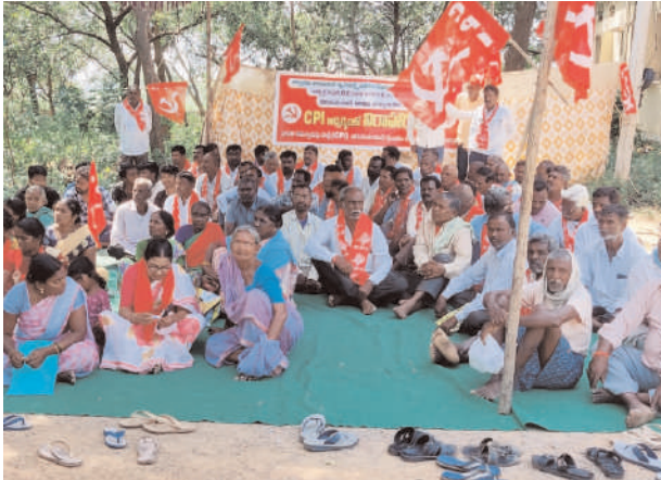
చిగురుమామిడి, అక్టోబర్ 6 (మనం న్యూస్): రాష్ట్ర ప్రభుత్వం అమలు చేస్తోన్న బిసి బంధు పథకాన్ని అసర్దులకు వర్తింపజేస్తూ, అర్హులైన నిరుపేదలకు అన్యాయం చేస్తున్నారని నిరసిస్తూ సిపిఐ ఆధ్వర్యంలో శుక్రవారం మండల