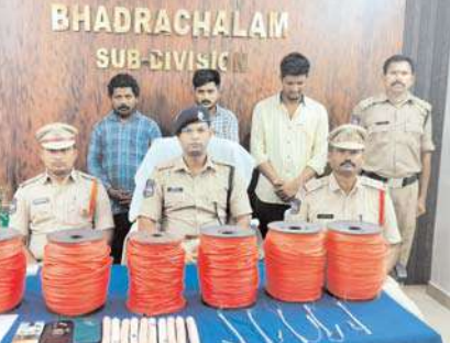
నిర్వహించాలనే ఆలోచనకు వచ్చినట్లు తెలిసింది. మారుమూల గ్రామాలు సమస్యాత్మకం కావడంతో ప్రచార భాద్యతలు లోకల్ కేడర్ లకు అప్పగించేందుకు ప్రణాళిక సిద్ధం చేస్తున్నారు. కాంగ్రెస్ పార్టీ నాయకులు మాజీ మంత్రి తుమ్మల, మాజీ ఎం పి పొంగులేటితో కలిసి భద్రాచలం టూ వాజీడు వరకు రోడ్ షో నిర్వహించాలని ప్రణాళికలు సిద్ధం చేశారు. మావోయిస్టుల హెచ్చరికతో రోడ్ షో రద్దు చేసుకునే అవకాశం ఉందని తెలిసింది.

మండలం సరిహద్దు గ్రామం పూసుగుప్పలో డ్రెపర్ మైన్ పేలి ఒక ఆవు చనిపోయింది. ఏజెన్సీ లోని పలు ప్రాంతాలలో ఎన్నికలు బహిష్కరించాలంటూ మావోయిస్టులు గోడ ప్రతులను అతికించారు. గతంలో మావోయి అధికార పార్టీ నాయకులనే టార్గెట్ చేసేవారు. కానీ తాజాగా విడుదల చేసిన లేఖలో ప్రతిపక్ష పార్టీ కాంగ్రెస్ నేతను కూడా టార్గెట్ చేస్తూ విమర్శించడంతో అభ్యర్థులలో టెన్షన్ వాతావరణం నెలకొంది. ఎలక్షన్ కోడ్ వెలువడిన తర్వాత భద్రాచలం నియోజకవర్గంలో పోలీసులు ముగ్గురు మిలిటెంట్ లతో పాటు ముగ్గురు మావోయిస్టు కొరియర్ లను అరెస్ట్ చేసి పెద్ద ఎత్తున పేలుడు సామాగ్రి స్వాదీనం చేసుకున్నారు. ఈ సంఘటనలతో అభ్యర్థులు కేవలం మండల హెడ్ క్వార్టర్స్ లోనే ప్రచారం