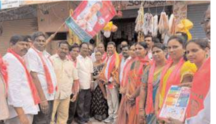
ప్రభుత్వంలో మధిర ప్రజల భాగస్వామ్యం ఉండాలన్నారు...ఈ ప్రచార కార్యక్రమంలో పలువురు ప్రజాప్రతినిధులు, పార్టీ నాయకులు, కార్యకర్తలు పాల్గొన్నారు.

బీఆర్ఎస్ ప్రభుత్వ హయాంలోనే మధిర పట్టణ అభివృద్ధి సాధ్యమైందని, 100 పడకల ఆసుపత్రి, మినీ ట్యాంక్ బండ్, ఇంటిగ్రేటెడ్ మార్కెట్, పార్కుల నిర్మాణం సహా కోట్లాది రూపాయల అభివృద్ధిని మధిర కు అందించిన ఘనత కేసీఆర్ దే అన్నారు.. నవంబర్ 30వ తేదీన జరిగే ఎన్నికల పోలింగ్ లో ఓటిసి ఆశీర్వాదించాలని తద్వారా మీ అందరికీ అండగా నిలబడి ప్రజలందరి సహకారంతో మధిర ను మరింత అభివృద్ధి చేసుకుందామన్నారు.. రూ.30 కోట్ల రూపాయలతో మధిర పట్టణం లో పలు అభివృద్ధి పనులు కొనసాగుతున్నాయన్నారు.మట్టి రాష్ట్రంలో అధికారంలోకి వచ్చే బీఆర్ఎస్