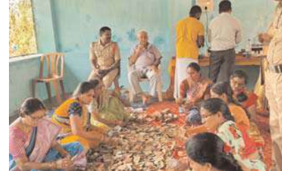
బానోత్ బస్సీలాల్, పంచాయతీ సిబ్బంది, ఆలయ సిబ్బందికి ప్రత్యేక ధన్యవాదాలు తెలిపారు.