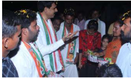
వచ్చే కాంగ్రెస్ ప్రభుత్వంలో పరిష్కరిస్తామని ధైర్యం చెప్పారు. ఇటీవల అనారోగ్యంతో మరణించిన వారి చిత్రపటాలకు