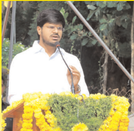
-అమరుల ఆశయాలను ముందుకు తీసుకెళ్లాలి -కలెక్టర్ విపి గాతమ్