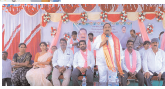
ఎంపీపీసీలు, మండల బీఆర్ఎస్ నాయకులు కార్యకర్తలు, స్థానిక ప్రజలు అధిక సంఖ్యలో హాజరయ్యారు.

మనముందుకు వస్తారు.వాళ్ల మాయమాటలు నమ్మి ఆగం కావద్దు.కండ్ల ముందు అభివృద్ధి కన్పిస్తుంది.మీ ఇంటి లో అభ్యర్థిగా నేను నిత్యం మీ మధ్య మీతో మీ ముందు ఉన్నాను. గత పదేండ్లుగా చేసిన అభివృద్ధి ఇంతకుముందు లేదు.. తెలంగాణ రాకముందు కళ్యాణ లక్ష్మి లేదు.కేసీఆర్ కిట్లు లేవు.. ఆనరా లేదు.. ఉమ్మడి రాష్ట్రంలో తండాలను గూడెంలను పంచాయతీలు చేయాలని మీరేన్నో ధర్నాలు. ఉద్యమాలు చేశారు, కానీ గత పాలకులు మీ ఆశలపై నీళ్లు చల్లారు, కానీ తెలంగాణ రాష్ట్ర వచ్చాక ముఖ్యమంత్రి కేసీఆర్ రాష్ట్రంలో ఉన్న ప్రతి తండాను ప్రతి గూడెం ను పంచాయతీలు చేశారు.. తండాల్లో మీ రాజ్యం తెచ్చారు.. ప్రతి తండాకు స్వచ్ఛమైన తాగునీళ్లతో