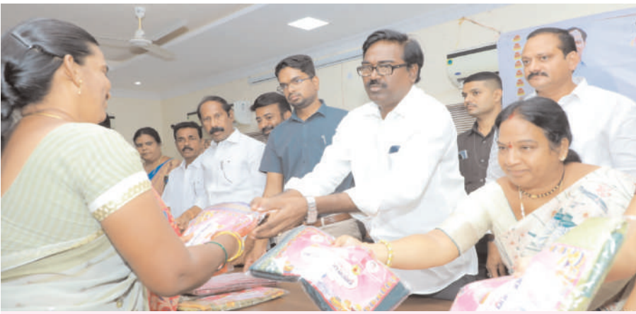
బతుకమ్మ చీరలను పంపిణీ చేస్తున్న మంత్రి పువ్వాడ అజయ్ కుమార్ (వార్త 13లో)