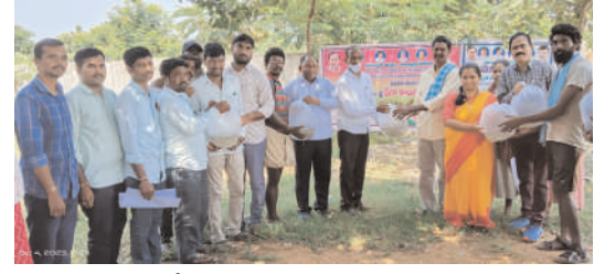
అందిస్తున్న ఉచిత చేప పిల్లలను ఆయకట్టు రైతులు సద్వినియోగం చేసుకోవాలని అన్నారు. చెరువులో చేపలను వదిలిన తర్వాత చెరువులో నీరు వృధా

అక్షపత్ని అక్టోబర్ 4 (మనం న్యూస్): తెలంగాణ ప్రభుత్వం అత్యంత ప్రతిష్టాత్మకంగా వంద శాతం రాయితీపై అందిస్తున్న చేప పిల్లలను బుధవారం భద్రాద్రి కొత్తగూడెం జిల్లా మత్స్యశాఖ అధికారి బి వీరన్న , ఎంపీపీ కొండ్రు మంజుభారణి చేతుల మీదుగా మండల కేంద్రంలోని 22 చెరువులకు పంపిణీ చేశారు. ఈ సందర్భంగా ఎంపీపీ కొండ్రు మంజు భారణి మాట్లాడుతూ తెలంగాణ ప్రభుత్వం