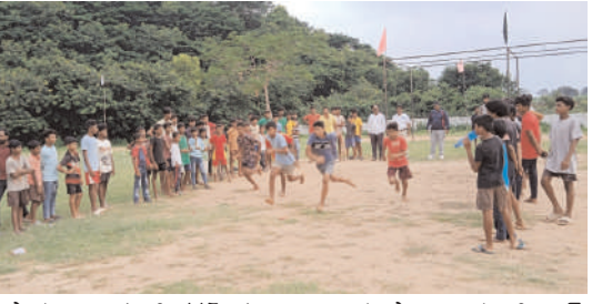
పాఠశాలల నుండి 115 మంది బాలురు పాల్గొన్నారు. డివిజన్ స్థాయిలో ఎంపికైన విద్యార్థిని, విద్యార్థులు జోనల్ స్థాయి గిరిజన క్రీడోత్సవాలలో పాల్గొంటారు. ఈ కార్యక్రమానికి వివిధ పాఠశాలల ప్రధానోపాధ్యాయులు, పిడి, పికటిలు, వార్డెన్లు తదితరులు పాల్గొన్నారు.