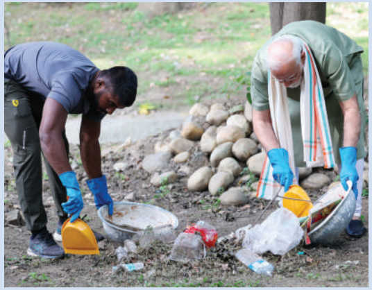
చీపురు పట్టి.. చెత్తను ఎత్తి.. ప్రధాని మోడీ శ్రమదానం! 2