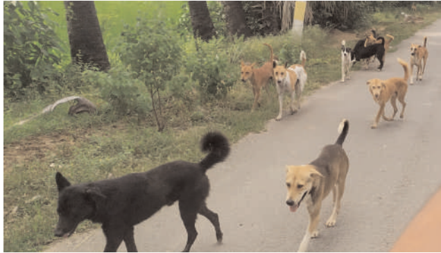
జరుగుతూనే ఉన్నాయి. గ్రామంలో కుక్కలు వింత జబ్బుతో సోకి ఇక్కడ తిరుగుతుండ ఉండడంతో ప్రజలకు

చెన్నారావుపేట, సెప్టెంబర్ 26, మనం న్యూస్ : మండల కేంద్రంలో వీధి కుక్కల సంఖ్య విపరీతంగా పెరిగిపోయింది. ఎక్కడపడితే అక్కడ రోడ్లపై చేరుకుని వచ్చిపోయే బాటసారులను కరవదానికి ప్రయత్నిస్తున్నాయని చీకటి వేళలో రోడ్లపై ఒంటరిగా నడవాలంటే వణుకు పడుతుంది కర్ర సహాయంతో ఇంటికి చేరుకునే పరిస్థితి ఏర్పడుతుందని గ్రామస్తులు ఆవేదన వ్యక్తం చేస్తున్నారు. కుక్కల వల్ల రోడ్డు ప్రమాదాలు జరిగిన సంఘటనలు అనేకం. చిన్నపిల్లలను, మేకలను కరవదం సర్వ సాధారణంగా