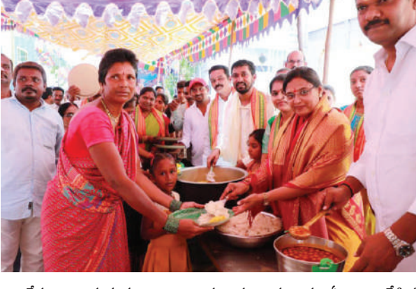
లు లేకుండా ఐక్యవత్సంగా ఉండాలన్నారు. అన్నదానం ఏర్పాటు చేసిన గణేష్ ఉత్సవకమిటీ సభ్యులను ఆమె అభినందించారు.