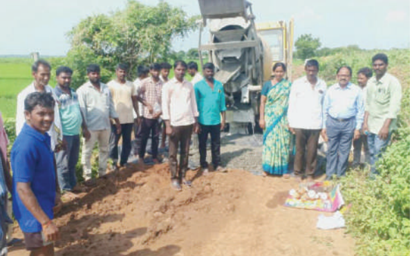
పాలకేడు, సెప్టెంబర్ 23. మనం ప్రతినిధి: డెక్లర్డ్ సీమెంట్స్ పరిధిలో ఉన్న అన్ని గ్రామాల్లో మాలిక్ సదుపాయాలను కల్పిస్తూ ప్రజలకు స్థూల అందుకుంటూ శనివారం మండల పరిధిలోని రావిపాడు గ్రామంలో మాలిక్ సదుపాయాల ఏర్పాటుకు రూ. 45లక్షలతో అదనంగా సీసీ రోడ్డు, సోలార్ విద్యుత్ దీప స్తంభాలు, ముగు దొడ్లు, బాడీ ఫ్రీజర్ అంగన్వాడీ నింటర్ రిపేర్లు, రోడ్డు రిపేర్లు, డ్రైనేజీ, బ్యూటీకీ నిర్మాణ కార్యక్రమం చేపట్టారు.