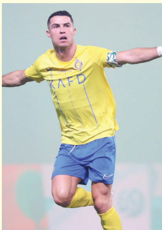
మార్క్ చేరుకు న్నాడు. అంటే.. అతడిని 60 కోట్ల మంది ఫాలో అవుతున్నారు. దాంతో, అత్యధిక మంది ఫాలోవర్స్ ఉన్న వ్యక్తిగా రికార్డు సృష్టించాడు.

పుట్టాల్ లెజెండ్స్ ఒకడైన రొనాల్డో తన అద్భుత ఆటతో ప్రపంచ వ్యాప్తంగా కోట్లాది మంది అభిమానులను సంపాదించుకున్నాడు. ఈమధ్యే అతను ఇన్స్టాగ్రామ్లో ఏకంగా 600 మిలియన్ల ఫాలోవర్ల