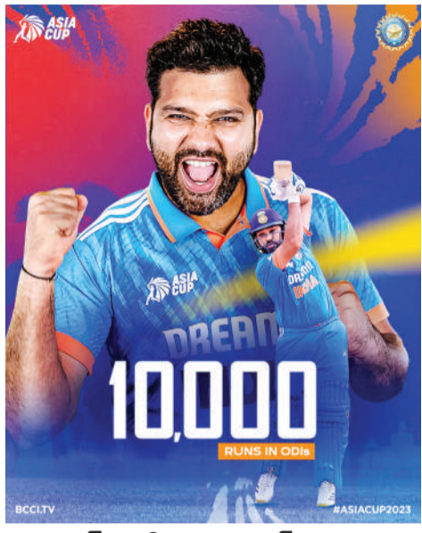
● గంభీర్ అసక్తికర కామెంట్స్

భారత మాజీ కెప్టెన్ మహేంద్రసింగ్ ధోనీ వల్లే రోహిత్ శర్మ ఇంత గొప్ప ప్లేయర్గా ఎదిగాడని మాజీ ఓపె