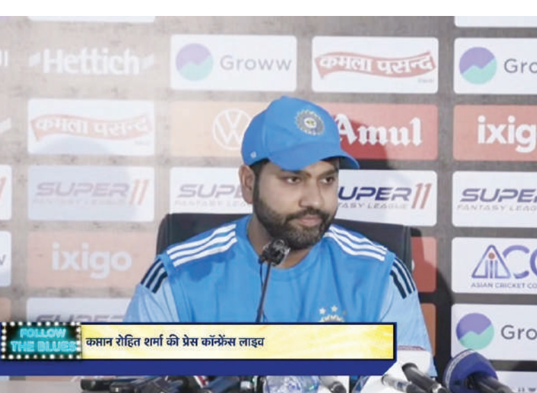
త. నేనెప్పుడూ జట్టు విజయం కోసం ఆడుతాను. గత కొన్నేళ్లగా నేను హై రిస్క్ అప్రోచ్ బ్యాటింగ్ చేశాను. పరిస్థితులకు తగ్గట్టు ఆడటం కూడా నాకు తెలుసు. ఏది ఏమైనా నా జట్టును మంచి స్థితిలో నిలవడమే నా పని. నేను మంచి రిడప్లయ్ ఉంటే.. నా వికెట్లు ఆస్లు పోయినా కోసం. వస్తేలో పరిస్థితులకు తగ్గట్టు ఆడాల్సి ఉంటుంది. టీ20లో ఇది అవసరం లేకపోయినా.. వస్తేలో మాత్రం తప్పనిసరి. మా జట్టులో షాహిన్, నసీమ్, హ్యూరీన్ రాఫ్ లేరు. మాకు అందుబాటులో ఉన్నవారితోనే మేం ప్రెపరయ్యాం. వాళ్లంత కూడా నాజూమైన బౌలర్లే. మా అనుభవాల్లో ఉపయోగించి పాక్ బౌలర్లను ఎదుర్కోవాలం. అని రోహిత్ శర్మ చెప్పాడు.