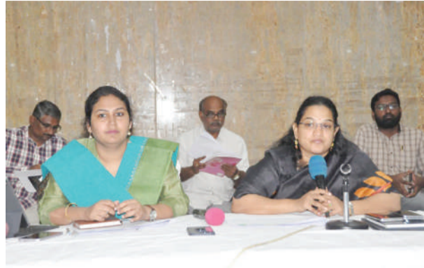
పెండింగ్లో ఉన్న స్టాన్ స్టాంట్స్ ప్రక్రియను శనివారం నాటికి పూర్తి చేయండి