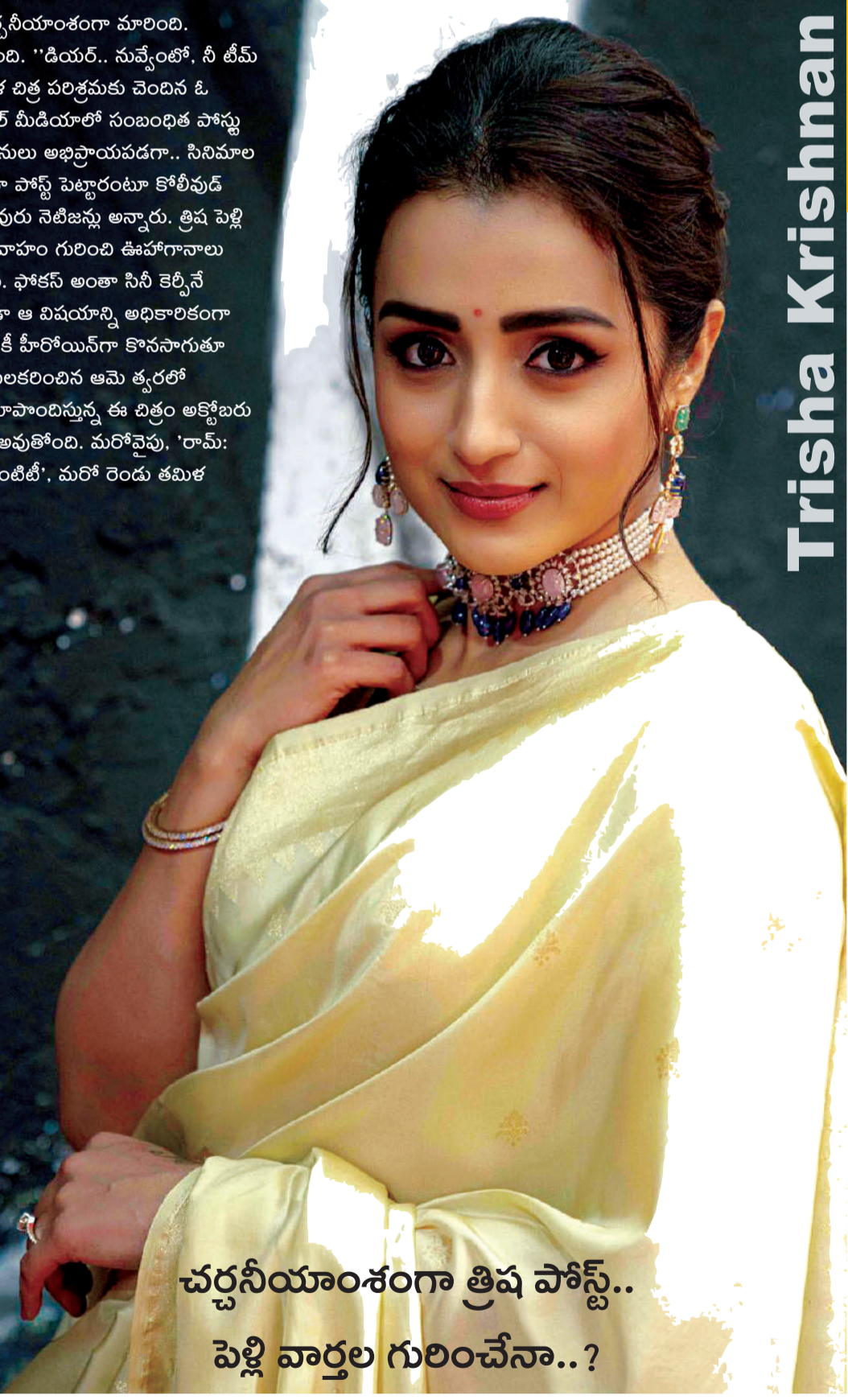
చర్చనీయాంశంగా త్రిష పోస్ట్.. పెళ్లి వార్తల గురించేనా..?