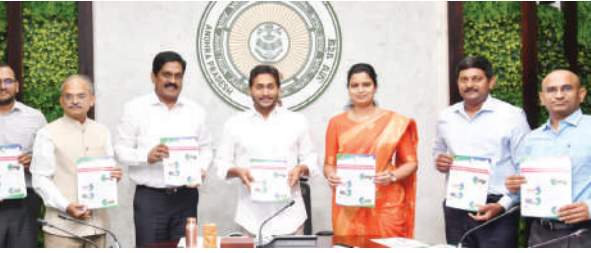
20న కేబినెట్ సమావేశం అమరావతి: ఈ నెల 20న ఆంధ్రప్రదేశ్ కేబినెట్ సమావేశం ముఖ్యమంత్రి వైయస్ జగన్మోహన్ రెడ్డి అధ్యక్షతన నిర్వహించనున్నారు. ఈ సమావేశంలో కీలక అంశాలపై మంత్రి మండలి నిర్ణయం తీసుకోనుంది. అసెంబ్లీ సమావేశాల నిర్వహణపై చర్చించనుంది. కాగా, ఈ నెల 21 నుంచి ఏపీ అసెంబ్లీ సమావేశాలు అయిదు రోజుల పాటు జరగనున్నట్లు ప్రాథమిక సమాచారం. అవసరాన్ని బట్టి మరో రెండు రోజులు పెంచే అవకాశముంది. కాంక్షాత్మక ఉద్యోగుల క్రమబద్ధీకరణ బిల్లును ఈ సమావేశాల్లో ప్రవేశపెట్టునున్నట్లు తెలుస్తోంది. జేపీ కాకుండా కొన్ని ఆర్డీసెన్యులకు సంబంధించిన బిల్లులు, మరెన్నో కొత్త బిల్లులను సమావేశాల్లో ప్రభుత్వం ప్రవేశపెట్టే అవకాశం ఉంది.

మందులు కావాలి సూచిస్తాం. ఒకవైపు తనిఖీలు చేస్తూనే.. మందులు కూడా ఇవ్వబోతున్నాం. ఇది చాలా పెద్ద మార్పు. దీనికి సంబంధించిన బాధ్యత మీరు తీసుకోవాలి అని సీఎం చెప్పారు. ఈ కార్యక్రమం ద్వారా గ్రామంలో ప్రతి ఇళ్ల కవర్ కావాలి. క్రాసిక్ పేషెంట్ల ఉన్న ఇళ్లను మరింత ప్రత్యేకంగా లక్ష్యంగా చేసుకుని పనిచేయడంలో పాటు వారిని చేయబట్టుకుని నడిపించాలి. ఈ కార్యక్రమంలో గర్భవతులు, బాలింతలతో పాటు రక్షణతన ఉన్నవళ్లకు కూడా గుర్తించాలి. దీక్షకాలిక వ్యాధులతో బాధపడుతున్నవారు, నియోనెటల్ కేసులతో పాటు బీజీ, షుగర్ వంటి వాటితో బాధపడుతున్నవారికి కూడా చికిత్స అందించాలి. ప్రతి మండలంలో నెలకు 4 గ్రామాలలో ఈ క్యాంపులు నిర్వహించాలి. దీనివల్ల ప్రతి 6 నెలలకోసం అది మండలంలో ఉన్న ప్రతి గ్రామంలోనూ హెల్త్ క్యాంపు నిర్వహించినట్లువుతుంది. ఈ నెల 9న కార్యక్రమం ప్రారంభమవుతుంది. రూ.1 ఖర్చు కూడా లేకుండా ప్రజలకు ఉచితంగా వైద్యం అందించడం