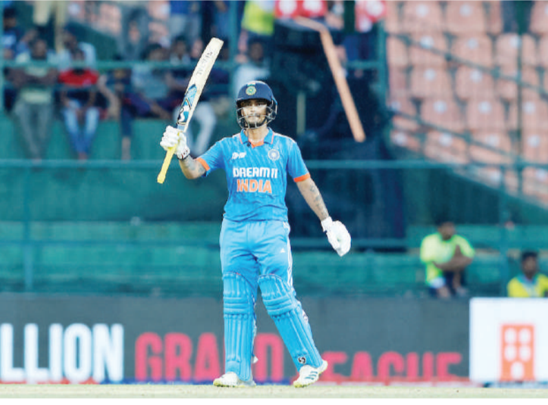
బౌలర్లలో షాహీన్ షా అఫ్రిది నాలుగు వికెట్లు తీయగా.. హార్దీన్ రౌఫ్, నసీమ్ షా మూడో వికెట్లు తీసారు. వైస్ కెప్టెన్ హార్దిక్ పాండ్యాతో కలిసి మెచ్చుర్గా బ్యాటింగ్ చేసిన ఇషాన్ కిషన్.. తనదైన షాట్లతో పాక్ బౌలర్లపై ఎదురుదాడికి దిగాడు. ఈ క్రమంలో 54 బంతుల్లో 6 ఫోర్లు, సిక్స్ నాయంతో హాఫ్ సెంచర్ పూర్తి చేసుకున్నాడు. అనంతరం సెంచర్ దిశగా సాగిన అతని ఇన్నింగ్స్ను హార్దీన్ రౌఫ్ బ్రేక్ చేశాడు. ఊరించే బౌన్సర్తో క్యాచ్ బెటంగా పెవిలియన్ చేర్చాడు.

టీమిండియా వికెట్ కీపర్ కమ్ బ్యాటర్ ఇషాన్ కిషన్ అరుదైన ఘనతను సొంతం చేసుకున్నాడు. ఆసియా కప్ 2023లో భాగంగా పాకిస్తాన్ జరిగిన మ్యాచ్లో అసాధారణ బ్యాటింగ్ చెలరేగిన ఇషాన్ కిషన్(81 బంతుల్లో 9 ఫోర్లు, 2 సిక్స్ తో 82).. టీమిండియా మాజీ కెప్టెన్ మహేంద్ర సింగ్ ధోనీ రికార్డు బద్దలు కొట్టాడు. ఆసియా కప్ చరిత్రలో పాకిస్తాన్ అత్యధిక పరుగులు చేసిన భారత వికెట్ కీపర్ ఇషాన్ కిషన్ చరిత్రకర్తాడు. ఈ క్రమంలో ధోనీని అధిగమించాడు. 2008 ఆసియా కప్ పాకిస్తాన్పై ధోనీ 76 పరుగులు చేశాడు. ఇప్పటి వరకు ఇదే టాప్ ఇండగా ఇషాన్ కిషన్ అధిగమించాడు. ఈ జాబితాలో ఇషాన్ కిషన్(82), ధోనీ(76), ఎస్సీ ఖన్నా(56) తర్వాతి స్థానాల్లో ఉన్నారు. ఆసియా కప్ చరిత్రలో ఓ వికెట్ కీపర్ 50 ప్లస్ రన్స్ చేయడం ఇది నాలుగోసారి మాత్రమే. ఇత వన్డే పాస్ పోల్లో ఇషాన్ కిషన్ ఇది వరుసగా నాలుగో హాఫ్ సెంచర్. భారత్ తరపున ఈ ఘనత సాధించిన రెండో భారత వికెట్ కీపర్ ఇషాన్ కిషన్ గర్వింపు పొందాడు. పాకిస్తాన్ తొలి ఇన్నింగ్స్ 50 ప్లస్ రన్స్ చేసిన రెండో భారత లెఫ్టాండర్ నిలిచాడు. భారత్ తరపున వరుసగా నాలుగు హాఫ్ సెంచర్లు బాదిన దిగ్గజ ఆటగాళ్లు సచిన్ టెండూల్కర్, సౌరభ్ గంగూలి, శ్రేయస్ అయ్యర్, సుచిత్ రైసా. మహమ్మద్ అజారుద్దీన్ వరుసగా ఇషాన్ కిషన్ నిలిచాడు. ఈ మ్యాచ్లో 86 పరుగులకి నాలుగు కీలక వికెట్లు కోల్పోయి పీకల్లోతు కష్టాల్లో పడిన భారత జట్టును.. ఇషాన్ కిషన్ సూపర్ బ్యాటింగ్తో ఆదుకున్నాడు. హార్దిక్ పాండ్యా(90 బంతుల్లో 7 ఫోర్లు, సిక్స్ 87)తో కలిసి ఐదో వికెట్లు 198 పరుగుల రికార్డు భాగస్వామ్యాన్ని అందించాడు. దాంతో ముందుగా బ్యాటింగ్ చేసిన భారత్ 48.5 ఓవర్లలో 286 పరుగులకు కుప్పకూలింది. పాకిస్తాన్