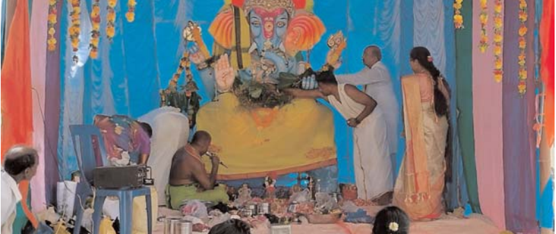
నినాదాలు చేస్తూ యువకుల కేరింతల తో పండుగ వాతావరణం నెలకొంది.

వేములపల్లి సెషెంబర్ 19 (మనం న్యూస్): వినాయక చవితి సందర్భంగా మండలంలోని పలు గ్రామాలలో వాడవాడల గణనాథులను ఏర్పాటు చేసి ప్రత్యేక పూజలు నిర్వహించి ప్రసాదాలు పంచి పెట్టారు. మండల కేంద్రంలోని శ్రీకృష్ణ యాత్, రాధాకృష్ణ యాత్, చత్రపతి శివాజీ, అంబేద్కర్ యాత్ ఆధ్వర్యంలో వినాయక విగ్రహాలను ఏర్పాటు చేసి వినాయక చవితి వేడుకలను ఘనంగా జరుపుకున్నారు. రాత్రి స్తోత్రములు వినాయక విగ్రహాల వద్ద ప్రత్యేక ప్రార్థనలు నిర్వహించి ప్రసాదాలు పెట్టారు. ఫోటా పోటీగా విగ్రహాలు ఏర్పాటు చేసి వివరికి వారు జై గణేశ్, జై గణేశ్, గణేశ్ మహారాజ్ కి జై అంటూ