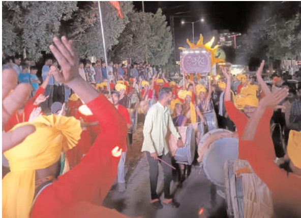
ఏకరూప దుస్తులు ధరించి కళాకారుల బృందం ఆటపాటలతో గణేష్ శోభాయాత్ర నిర్వహించారు. అంబికా ఆర్కేడ్ ఆధ్వర్యంలో సిద్ది వినాయక నవరాత్రి ఉత్సవాలు వైభవంగా జరిగాయి. కాంతార వేషధారణతో సిద్దిపేట

సిద్దిపేట రూరల్, సెప్టెంబర్ 28, మనం న్యూస్: వినాయక నిమజ్జనోత్సవ కార్యక్రమం అత్యంత వైభవంగా కోలాటాలతో, డాన్స్లతో, నృత్యాలతో జిల్లా కేంద్రంలో ఘనంగా నిర్వహించారు. వివిధ ప్రాంతాల నుండి వచ్చిన కళాకారులతో నిమజ్జనోత్సవ కార్యక్రమం అత్యంత వైభవంగా అందరినీ ఆకట్టుకున్నాయి. వీరసావర్కర్ సేవా సమితి ఆధ్వర్యంలో మొదటి వార్షికోత్సవంలో భాగంగా ఏర్పాటు చేసిన నాందేడ్ కళాకారులచే డప్పు చప్పుళ్లతో, శ్రీరాముని ప్రతిమతో నిమజ్జనోత్సవ ర్యాలీని ఘనంగా నిర్వహించారు. సంతోషిమాత ఫ్యామిలీ ఆసోసియేషన్ ఆధ్వర్యంలో తొమ్మిది రోజుల పాటు అత్యంత భక్తి శ్రద్ధలతో పూజలు నిర్వహించి చివరి రోజైన గురువారంనాడు కుటుంబ