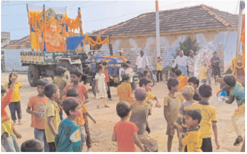
ఘనంగా వినాయకుడి శోభాయాత్ర