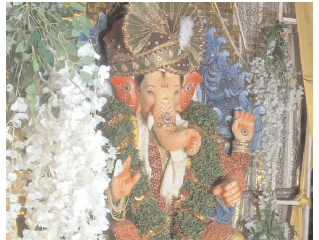
ప్రజలను అలరించారు. ప్రత్యేకమైన లైటింగ్తో వినాయక నవరాత్రి ఉత్సవాలను దేదీప్యమానంగా నిర్వహించారు. గల్లీగల్లీలో యూత్ల ఆధ్వర్యంలో ఏర్పాటు చేసిన వినాయక విగ్రహాలను డిజై చప్పుళ్లతో, కళాకారుల బృందంతో, బాణాసంచా పేలుళ్లతో గంగమ్మ ఒడికి