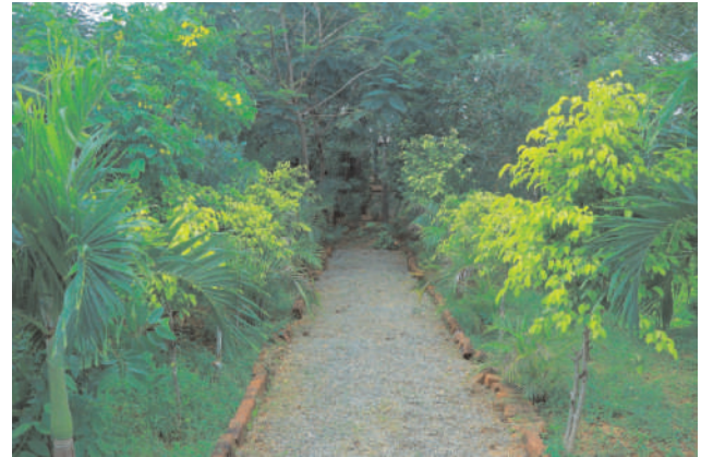
అభివృద్ధి ముందుకు సాగుతుంది.

చేసిన పల్లె ప్రకృతి వనం చిట్టడివిని తలపిస్తూ పల్లెకు సరికొత్త అందాన్ని తెచ్చిపెట్టింది. దానితోపాటు పండల మొక్కలు, గ్రీన్ నర్సరీ మొక్కలు నాటడంతో ఉదయం, సాయంత్ర సమయాలలో స్థానికులు పార్కులలో కాలక్షేపం చేస్తూ ఆనందాన్ని పొందుతున్నారు. ఊరంతా సీసీ రోడ్డు, వందశాతం ఇంకుడుగుం తలు నిర్మించుకొని పరిశుభ్రత పాటిస్తున్నారు. రోడ్డు పక్కన, విలేజ్ పార్కులో నాటిన మొక్కలను సంరక్షించుకునేందుకు ట్యాంకర్ ద్వారా నీటిని అందిస్తూ మొక్కలను కంటికి రెప్పలా కాపాడుకుంటున్నారు. మిషన్ భగీరథలో భాగంగా ప్రతి ఇంటికి తాగునీరు అందుతుంది. కంపోస్ట్ యార్డు, గ్రేవ్ యార్డు ఇతర నిర్మాణాలను గ్రామస్తుల ఆవసరాలకు అనుగుణంగా ఏర్పాటు చేసుకుంటున్నారు. ఎవెన్యూ ప్లాంటేషన్ పల్లె ప్రకృతి వనాలతో ఎక్కడ చూసినా గ్రామమంతా పచ్చదనాన్ని అలుముకుంది. రూ. 5 లక్షలతో కంపోస్ట్ యార్డు, రూ. 20 లక్షల పై చిలుకుతో సీసీ రోడ్ నిర్మాణం, ఇతర అభివృద్ధి పనులకు మొత్తంగా ఇప్పటి వరకు రూ. 82.60 లక్షలను మంత్రి హరీష్రావు అందించగా గ్రామం అన్నింటా