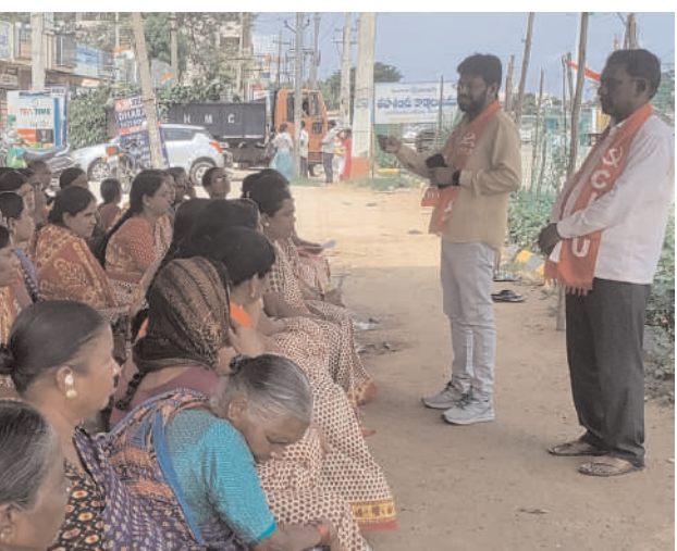
పటానెచెరు, సెప్టెంబర్ 13, మనం న్యూస్: అంగన్ వాడీ ఉద్యోగుల సమస్యలు పరిష్కరించకపోతే సమ్మెను మరింత ఉధృతం చేస్తామని సిబిటీయూ రాష్ట్ర కమిటీ