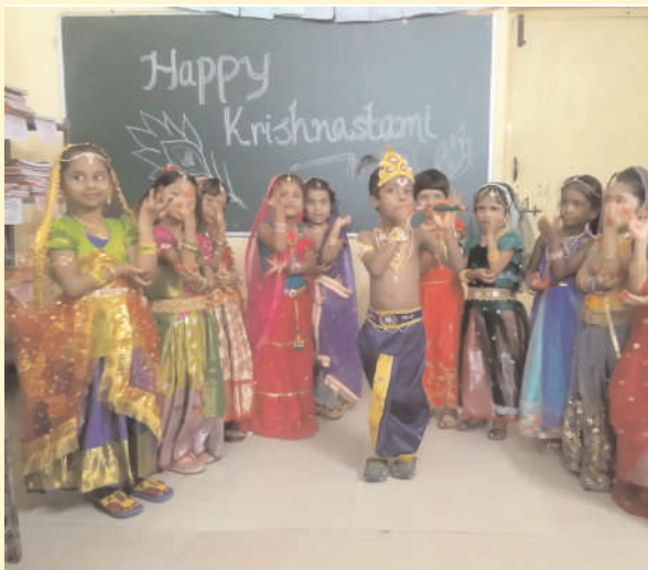
సిద్దిపేట రూరల్, సెప్టెంబర్ 06, మనం న్యూస్: హిందువులకు అతి