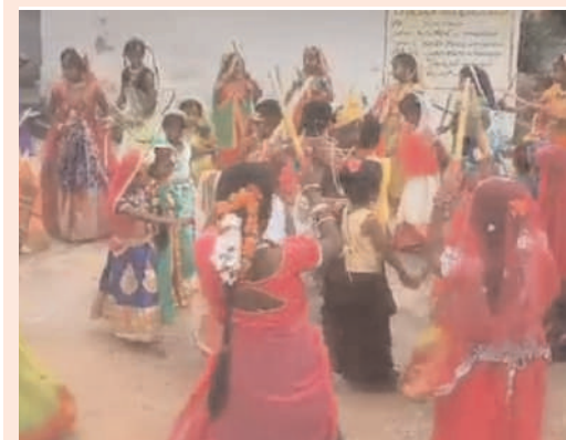
ఘనంగా శ్రీ కృష్ణాష్టమి వేడుకలు గోపికల వేషధారణలో ఆలరించిన చిన్నారులు