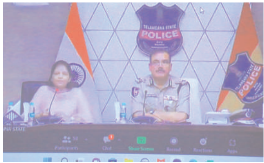
ఉత్తమ పోలీస్ స్టేషన్లకై