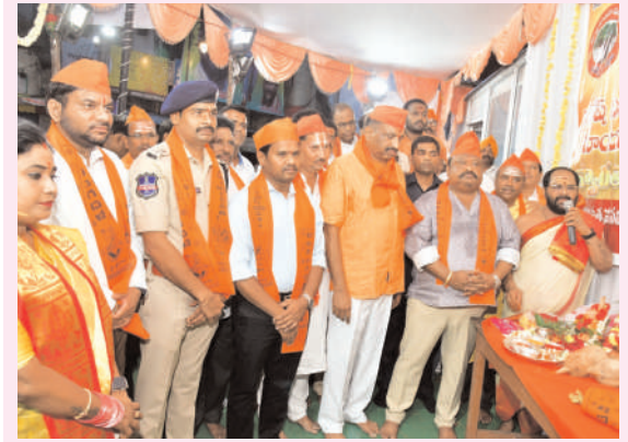
మొదటి పేజీ తరువాయి..

పాటు చుట్టు పక్కల ప్రాంతాల ప్రజలు అధిక సంఖ్యలో రావడంతో ఈ ప్రాంతమంతా కిక్కిరిసిపోయింది. శోభాయాత్ర, నిమజ్జనోత్సవ కార్యక్రమం సందర్భంగా ఎలాంటి అవాంఛనీయ ఘటనలు చోటుచేసుకోకుండా పోలీసు యంత్రాంగం గట్టి బందోబస్తు ఏర్పాటు చేసింది. నిమజ్జన కార్యక్రమం జరిగే ప్రాంతాలైన మానకొండూరు, కొత్తపల్లి చెరువు, చింతకుంట కెనాల్ వద్ద నగర పాలక సంస్థ ఆధ్వర్యంలో ఏర్పాట్లు చేపట్టారు. చెరువులు, కెనాల్ వద్ద ఎలాంటి ప్రమాదాలు సంభవించకుండా తగు జాగ్రత్తలు తీసుకున్నారు. ఆయా ప్రాంతాల్లో గజ ఈతగాళ్లను అందుబాటులో ఉంచారు.