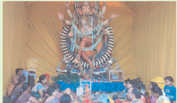
దానాలు నిర్వహిస్తున్నారు. శుక్రవారం కమ్మరి వాడలోని గణేష్ మండపం