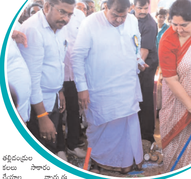
తల్లిదండ్రుల కలలు సాకారం చేయాల న్నారు. ఈ