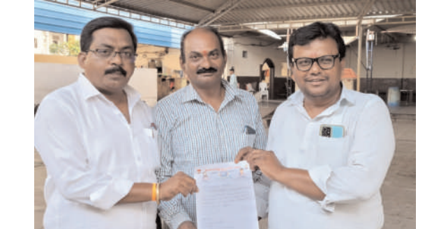
బిసి సంక్షేమ సంఘం