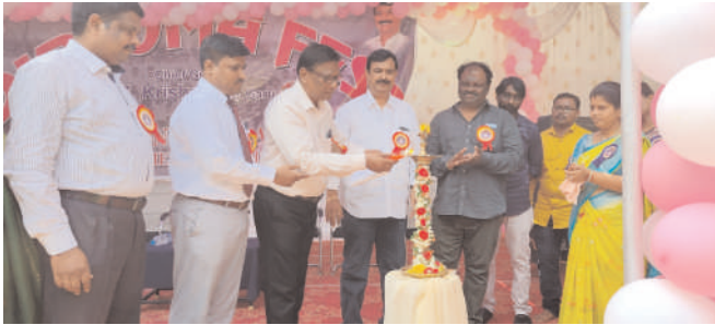
శ్రీనివాసరావు తదితరులు పాల్గొన్నారు.