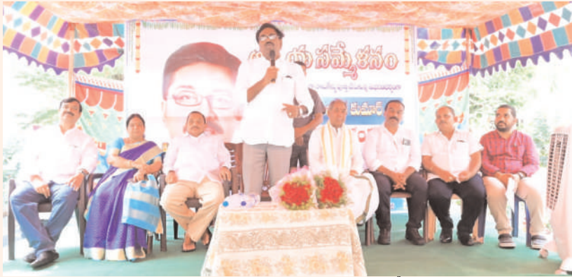
అందించా. ఒక్క ఇంటిని కూడా వదలకుండా ప్రతి ఇంటికి తాగునీరు