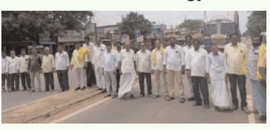
దమ్మపేట, సెప్టెంబర్ 9(మనం న్యూస్) :