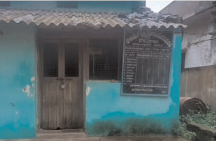
షాప్ ముందు ఎవరు ఈ విషయాన్ని ప్రదర్శించాలన్నారు. ప్రతినెల బియ్యం ఎప్పుడు ఇస్తారోనని గ్రామీణ ప్రాంతాల్లో పట్టణాల్లో రోజూ కూలి చేసుకునేవారు పని మానుకొని చౌక దుకాణం ఎదుట కూర్చుని వేచి చూడాల్సిన పరిస్థితి నెలకొందన్నారు. కూలి నష్టపోయి యజమానుల దగ్గర ఇబ్బంది పడి సమయానికి రేషన్ బియ్యం అందక వారు పడే ఇబ్బంది అంతా ఇంతా కాదని ఆయన తెలిపారు. సమయ పాలన పాటించని డీర్లర్లపై చర్యలు తీసుకోవాలన్నారు.

బూర్గంపహాడ్, సెప్టెంబర్ 9 (మనం న్యూస్): బూర్గంపహాడ్ మండల కేంద్రంలో చుట్టుపక్కల గ్రామాల్లో చౌక దుకాణాల్లో బియ్యం సరఫరా ఎప్పుడు చేస్తారో తెలియని దుస్థితి నెలకుందని సిపిఐ (ఎంఎల్) న్యూ డెమోక్రసీ జిల్లా నాయకులు డి.పున్నంచంద్ ఆరోపించారు. ఒక నెల ఒక తేదీలో సరఫరా చేస్తే ఇంకో నెల మరో తేదీలో ఇవ్వడం పరిపాటి గా మారందని, దీంతో ప్రతి నెల రేషన్ దుకాణానికి ఏ తేదీన, ఏ సమయంలో వెళ్లాలో లబ్ధిదారులు అయోమయానికి గురవుతున్నారని అన్నారు. అధికారుల పర్యవేక్షణ లోపంగా ఇష్టారాజ్యంగా పంపిణీ జరుగుతోందన్నారు. చౌక దుకాణాల ఎదుట బోర్డులో స్టాకు వివరాలు ఉండటం లేదన్నారు. నెలకు ఎన్ని రోజులు పంపిణీ చేస్తారు ?, ఏ తేదీన మొదలుపెట్టి ఏ తేదీ వరకు బియ్యం ఇస్తారు ?, ఏ సమయంలో మొదలుపెట్టి ఏ సమయం వరకు ఇస్తారు ?, అసలు రేషన్ షాప్ పరిధిలో ఎంతమంది లబ్ధిదారులు ఉన్నారు, ఎవరెవరికి ఎంత ఇస్తున్నారు,