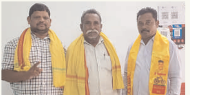
కరకగూడెం, సెప్టెంబర్ 9 (మనం న్యూస్):

ఆంధ్రప్రదేశ్ మాజీ ముఖ్యమంత్రి నారా చంద్రబాబు నాయుడుని సిల్వర్ డెవలప్మెంట్ స్కాం పేరుమీద అక్రమంగా అరెస్టు చేయడం తీవ్రంగా ఖండిస్తున్నామని తెలుగుదేశం పార్టీ మండల అధ్యక్షులు సిరిశెట్టి కమలాకర్ అన్నారు. ఆయన మాట్లాడుతూ ఒక మాజీ ముఖ్యమంత్రిని అక్రమంగా అరెస్టు చేయడం సరైన పద్ధతి కాదని ఆంధ్రప్రదేశ్ రాష్ట్రంలో తెలుగుదేశం పార్టీ అధికారంలోకి వస్తేనే భయంతో స్వీముల పేరుతో అక్కడ సీఎం జగన్మోహన్ రెడ్డి అక్రమ అరెస్టులు చేయడానికి తీవ్రంగా ఖండిస్తున్నామని అన్నారు. జగన్ కు త్వరలోనే ప్రజలు సరైన గుణపాఠం చెప్పే రోజులు దగ్గరలో ఉన్నాయని ఆయన అన్నారు. ఈ కార్యక్రమంలో అనంతరం మాజీ సర్పంచ్ పాయం. లక్ష్మీనారాయణ, ఈసం. సత్యనారాయణ పాల్గొన్నారు