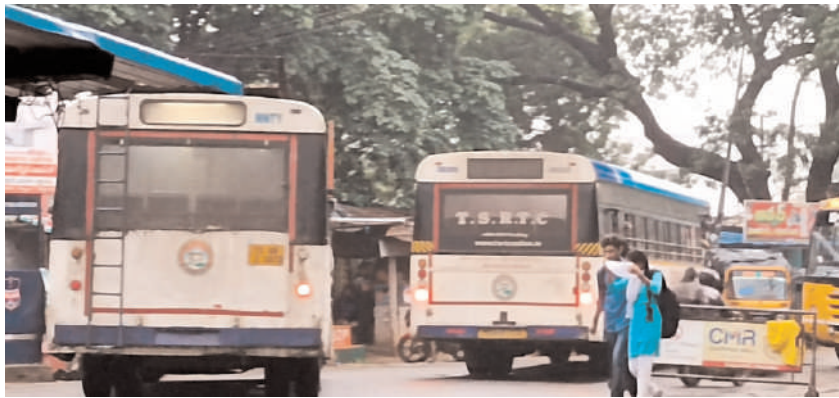
నిరుపయోగంగా ఉన్న వాటిని పునరుద్ధరించే ప్రజలు కోరుకుంటున్నారు. ముఖ్యంగా ఆర్టీసీ బస్టాండ్ ని ఉపయోగం లోకి తీసుకురావాలని కోరుతున్నారు.

బూర్గంపహాడ్, సెప్టెంబర్ 7 (మనం న్యూస్): బూర్గంపహాడ్ మండల కేంద్రంలో గల ఆర్టీసీ బస్టాండ్ కొన్ని సంవత్సరాలుగా నిరుపయోగంగా పడి ఉంది. దీని వల్ల ప్రయాణికులు చాలా ఇబ్బంది పడుతున్నారు. ఆర్టీసీ బస్సులను రోడ్డు మధ్యలో ఆపి ప్రయాణికులను ఎక్కించుకుంటున్నారు. దీనివల్ల వాహనదారులకు ఇబ్బంది కలుగుతోంది. ట్రాఫిక్ అంతరాయమే కాకుండా ప్రమాదాలు జరిగే అవకాశం కూడా ఉన్నది. పేరుకే మండల కేంద్రం.. ఏ వసతులు ఉండవు. ప్రజాప్రతినిధులు, అధికారులు పట్టించుకోరు. గ్రామసభల్లో మండల కేంద్రాన్ని తీర్చిదిద్దతాం అలా చేస్తాం ఇలా చేస్తాం అని వాగ్దానాలు చేసి స్టేజీ దిగిన వెంటనే మరిచిపోతున్నారనే విమర్శలు వినిపిస్తున్నాయి. కొత్త ప్రయాణనాలు తేకపోయినా పర్వాలేదు,