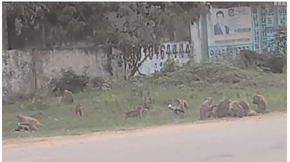
పథకాలు ఇవ్వకపోయినా పర్యాటకుల కోతుల బెడద నుండి కాపాడాలని పిల్లల తల్లిదండ్రులు గ్రామ ప్రజలు మొరపెట్టుకుంటున్నారు. సైరైజేషన్, (గర్బనిరోధం) పునరావాసం, అణిచివేయడం, తరలించడం వంటి ప్రక్రియల ద్వారా కోతులు బెడద నియంత్రించవచ్చునని పర్యావరణవేత్తలు నిపుణులు సూచిస్తున్నారు. ఈ విషయంలో ప్రభుత్వం వెంటనే తగిన చర్యలు తీసుకోవాలని కోతులు బెడద నుండి ప్రజలను రక్షించాలని కోరుతున్నారు.

బూర్గంపహాడ్, సెప్టెంబర్ 6 (మనం న్యూస్): అధునిక కాలంలో మనిషి విచక్షణారహితంగా చెట్లను అడవులను ధ్వంసం చేయడంతో కోతులు మానవ ఆవాసులపైకి దండయాత్ర చేయవలసిన అవసరం ఏర్పడింది. ఇల్లు, పంట పొలాలను చిందర వందర చేయడం పరిపాటింది. గ్రామాల్లో కూరగాయల వండ్లు ఫలాల చెట్ల మీద పడి ధ్వంసం చేస్తున్నాయి. కోతుల వలన ఆరు బయట కూర్చోవాలన్నా అంటు బోలెలు కడిగే వాళ్ళు గానీ పిల్లలు ఆడుకోవాలని చాలా భయంగా మారింది. గ్రామ ప్రాంతాల్లో కోతులు బెడద ప్రధానంశంగా మారినట్లు అతిశక్తి కాదు. కోతల బెడద సమస్యపై 2016 డిసెంబర్ 29 న తెలంగాణ అసెంబ్లీ చర్చకు వచ్చింది. స్వయంగా ముఖ్యమంత్రి కోతులు బెడద తీవ్రంగా ఉందని ఒప్పుకున్నారు. ముఖ్యమంత్రి అధ్యక్షతన 2021 నవంబర్ 29న ఈ సమస్యపై క్యాబినెట్ మీటింగ్ జరిగింది. డిసెంబర్ 1న ప్రభుత్వ ప్రధాన కార్యదర్శి సోమేశ్ కుమార్ రివ్యూ సమావేశం నిర్వహించారు. అధికారులు వారం రోజుల్లో గా పరిష్కార మార్గాలు సూచించాలని ఆదేశించారు. 19 నెలలు కావస్తున్నా కనీసం కార్యాచరణ లేదని ప్రజలు విమర్శిస్తున్నారు. ఇటీవల కాలంలో బూర్గంపహాడ్ గురుకుల పాఠశాలలో విద్యార్థులను కోతులు కరవపోవడము బెదిరించడం మీదికి వెళ్లడం వంటి పనులు చేసి భయాందోళనకు గురిచేశాయి. ప్రభుత్వం మాకు సంక్షేమ