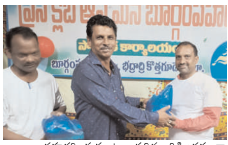
సహకరించుకుంటూ పదిమందికీ ఆదర్శంగా జర్నలిస్టుగా నిలబడాలని ఆశాభావం వ్యక్తం చేశారు. ఈ కార్యక్రమంలో ప్రెస్ క్లబ్ ఆఫ్ మన బూర్గంపహాడ్ సభ్యులందరూ పాల్గొన్నారు. ఈ సందర్భంగా సభ్యులందరికీ మితాయిలు ప్రెస్ క్లబ్ సింబల్ తో కలిగిన టీ పర్షు అందజేశారు.

న్యాయం జరిగేందుకు ఎంతవరకైనా పాతికేయ మిత్రులు వెళ్లవచ్చని ఎటువంటి భయము వద్దని జర్నలిస్టుగా తన వృత్తి ధర్మాన్ని నిర్వహించాలని సూచించారు. అక్రమార్కుల గుండెల్లో రైళ్లు పరిగెత్తాలంటే నికార్తైన వార్తలను రాయాలని, వార్తలు క్షేత్రస్థాయిలో సేకరణ చేయాలని అందరికీ జర్నలిస్ట్ అంటే ఆదర్శంగా ఉండాలని సూచనలు చేశారు. పలువురు మిత్రులు మాట్లాడుతూ అందరం ఎన్నో సంవత్సరాలుగా కలిసిమెలిసి జర్నలిస్టుగా ఈ ప్రెస్ క్లబ్ లో ఉంటున్నట్లుగా ఇదేవిధంగా మునుముందు కూడా కొనసాగాలని అందరూ కలిసిమెలిసి పనిచేయాలని ఒకరినొకరు