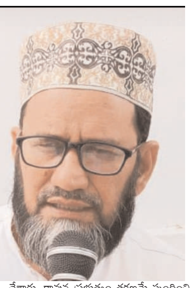
చేశారు. కావున ప్రభుత్వం తక్షణమే స్పందించి అరబ్బీ ట్యూటర్లకు ఔట్ సోర్సింగ్ ఉద్యోగులతో సమానంగా గుర్తించి, వారికి వేతనాలు పెంచుతూ పూర్తి స్థాయిలో వారిని ఉపాధ్యాయులుగా పని చేసే విధంగా తగు చర్యలు చేపట్టాలని కోరారు.