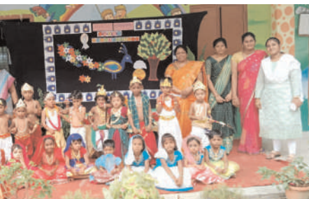
ఈ కార్యక్రమంలో ఉపాధ్యాయులు, తల్లిదండ్రులు పాల్గొన్నారు.

తెలుసుకోవడానికి జీవన సాఫల్యం అంతరాధ్యాత్మిక గ్రహించడానికి శ్రీ కృష్ణుని జీవన విధానం దోహదపడుతుందని అభిప్రాయ పడ్డారు. ఈ వేడుకలలో విద్యార్థులు వివిధ సాంప్రదాయ వేషధారణలలో అలరించారు. పాఠశాలలో ఏర్పాటు చేసిన గోకుల వేషధారలలో శ్రీ కృష్ణ, గోపికల వేషధారులై విద్యార్థులు ఉత్సాహంగా ఉట్టి కొట్టు వేడుకను నిర్వహించారు.