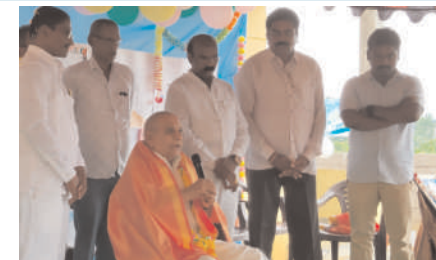
విద్యార్థులు వారి తల్లిదండ్రులు పాల్గొన్నారు