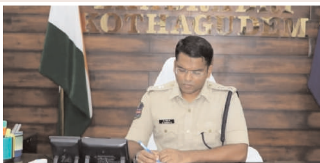
చర్యలు తీసుకుంటామని ఈ సందర్భంగా ఎస్సీ తెలియజేశారు.

సాధారణ సమస్యలు 03, చీటింగ్ కేసులకు సంబంధించి 01 ఫిర్యాదు ద్వారా సమస్యలను తెలుసుకున్నారు. వెంటనే సంబంధిత అధికారులకు సమస్యల పరిష్కారం కోసం ఆదేశాలు జారీ చేశారు. ఈ కార్యక్రమం ద్వారా తమ సమస్యలను తెలుపుకోలేని వారు నేరుగా ఎస్సీ కార్యాలయానికి వచ్చి తమ ఫిర్యాదు ద్వారా సమస్యను తెలుపుకోవచ్చని ఈ సందర్భంగా ఎస్సీ విజ్ఞప్తి చేశారు. సామాన్య ప్రజానికానికి ఇబ్బందులు కలిగించే వ్యక్తులపై కఠిన