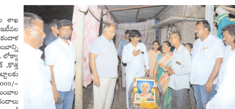
.సర్పంచులు .ఎంపీటీసీలు .పార్టీ నాయకులు. అందరూ పాల్గొన్నారు.