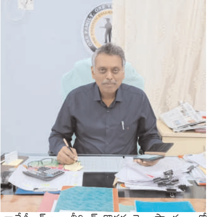
కాలేజీ ఆఫ్ ఇంజనీరింగ్, కొత్తగూడెం, ప్రాంగణం లో నిర్వహించబడే కౌన్సిలింగ్ కు ఉదయం 10:30 గంటలకు రిపోర్ట్ చేయాలని తెలిపారు.

యూనివర్సిటీ కాలేజ్ ఆఫ్ ఇంజనీరింగ్, కాకతీయ యూనివర్సిటీ, కొత్తగూడెం నందు 2023-24 సంవత్సరానికి గాను బి.టి.కోర్సులలో ప్రవేశానికి మిగిలిన సూపర్ న్యూమరి సీట్స్ కోసం రెండవ దశ కౌన్సిలింగ్ కొరకు దరఖాస్తులు కోరడమైనదని ఏరియా జియం జాన్ ఆనంద్ ఒక ప్రకటనలో తెలిపారు. ఈ సందర్భంగా వారు మాట్లాడుతూ అధికారుల ఉద్యోగుల పిల్లలకు 09 సీట్లు మిగిలి ఉన్నాయని తెలిపారు. మొదటిసారి కౌన్సిలింగ్ సమయంలో దరఖాస్తు చేసుకొని ఇప్పుడు అడ్మిషన్ తీసుకోవడానికి సిద్ధంగా ఉన్న అభ్యర్థులు కూడా వేదిక వద్ద కౌన్సిలింగ్ నేరుగా హాజరుకావడానికి అనుమతించనున్నట్లు తెలిపారు. ఇట్టి కౌన్సిలింగ్ లో పాల్గొనే అభ్యర్థులు కుల ధ్రువీకరణ పత్రం, స్టానికం/నాన్-లోకల్ సర్టిఫికేట్, 2023లో తెలంగాణా రాష్ట్రము నిర్వహించిన ఎంసెట్ ర్యాంక్ కార్డు, ఉద్యోగి ఐ.డి. కార్డు (ఒరిజినల్) తో తేది.06.09.2023(బుధవారం) నాడు యూనివర్సిటీ