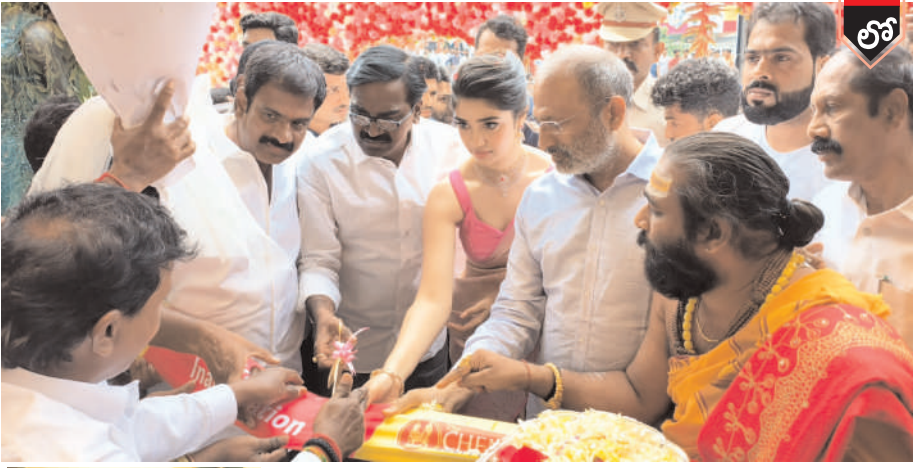
ఖమ్మంలో సినీనటి కృతిశెట్టి సందడి

- మంత్రి పువ్వాడ చేతుల మీదుగా 17వ షోరూం ఆరంభం - సందడి చేసిన జబర్దస్త్ టీమ్ - సరికొత్త హంగులతో ఖమ్మంలో రెండవ బ్రాంచ్ ప్రారంభం - భారీగా తరలివచ్చిన అభిమానులు