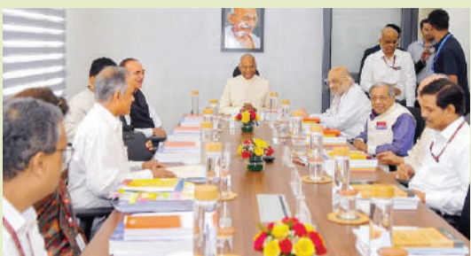
జాతీయ, రాష్ట్ర రాజకీయ పార్టీల

భాద్రపద మాసం, ఆదివారం, తిథి : నవమి ఉ.10.23 వరకు, వక్షతం: పూర్వాషాఢ, మ:01.41 వరకు, చక్షుం: సా.09.06-10.35 వరకు, దుర్ముహూర్తం: సా.04.31-05.19 వరకు, రాహుకాలం: మ.04.37-06.07 వరకు