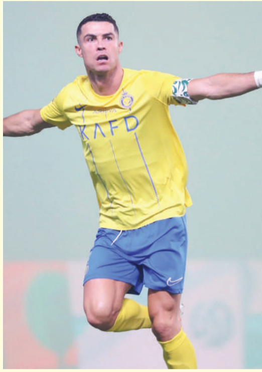
మార్కెట్ చేరుకున్నాడు. అంటే.. అతడిని 60 కోట్ల మంది ఫాలో అవుతున్నారు. దాంతో, అత్యధిక మంది ఫాలోవర్స్ ఉన్న వ్యక్తిగా రికార్డు సృష్టించాడు.

పుట్టాల్ లెజెండ్స్ ఒకడైన రోనాల్డో తన అద్భుత ఆటతో ప్రపంచ వ్యాప్తంగా కోట్లాది మంది అభిమానులను సంపాదించుకున్నాడు. ఈమధ్యే అతను ఇన్స్టాగ్రామ్లో ఏకంగా 600 మిలియన్ల ఫాలోవర్ల