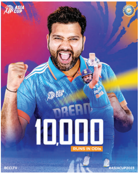
● గంభీర్ ఆసక్తికర కామెంట్స్

భారత మాజీ కెప్టెన్ మహేంద్రసింగ్ ధోనీ వల్లే రోహిత్ శర్మ ఇంత గొప్ప ప్లేయర్గా ఎదిగాడని మాజీ ఓపె