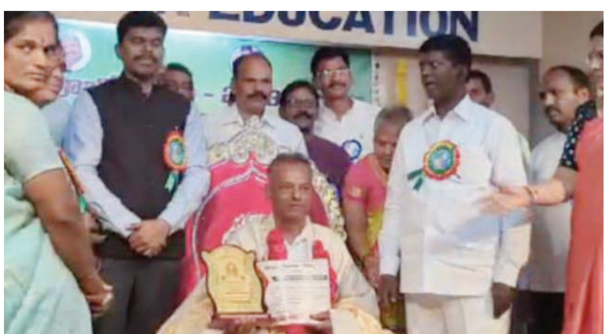
ధ్యాయ దినోత్సవం రోజు ఈ అవార్డు అందుకోవడం నాకు చాలా సంతోషంగా ఉంది, ప్రతి విద్యార్థికి విద్య పట్ల మక్కువ పెంచుకునే విధంగా విద్యార్థులను తీర్చిదిద్దే దిశగా పయనిస్తానని ఆయన తెలిపారు.