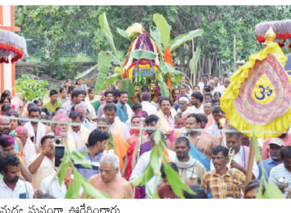
మధ్య ఘనంగా ఉరేగించారు.