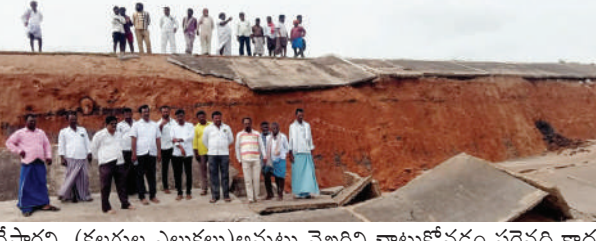
చేస్తారని, (కలగల్ల ఎలుకలు) అన్నట్లు వైఖరిని చాటుకోవడం సరైనది కాదని సామెత రూపంలో తెలియజేశారు. ప్రస్తుత జనాభా పెరుగుదలకు అనుగుణంగా ఒక టీఎంసీ నీటిని నిలుపుకునే విధంగా కట్ట నిర్మాణం చేపట్టాలని డిమాండ్ చేశారు. పక్కనే ఎల్ఎల్పీ కాలువ ప్రవహిస్తున్న పట్టణ ప్రజలకు సంపూర్ణమైన త్రాగునీరు అందించడంలో పాలకులు విఫలం చెందారన్నారు. పట్టణ సరిహద్దును ఉన్న కానీలకు వారానికి ఒక్కోసారి కూడా త్రాగునీరు అందించడం కలిగినవైన చర్యగా భావిస్తున్నారు. జరిగిన అవిని తిప్పి మునిసిపల్ అధికారులు విచారణ చేపట్టి శీత్ర పత్రం విడుదల చేయాలని కోరారు. సీఎం జగన్ మోహన్ రెడ్డి గతంలో పనిచేసిన కాంట్రాక్టర్ల రికవరీ చేసేందుకు చర్యలు తీసుకోవాలన్నారు. పట్టణ ప్రజలు ఆయా కానీలలో అధికారులపై పాలకులపై తిరగబడితే తప్ప తాగునీటి సమస్య పరిష్కారం అయ్యే ప్రసక్తి లేదని చెప్పుకోవచ్చు. 104 బనాపురం గ్రామానికి పాలి ఉన్న ప్రమాదం ఏ గతంలో కాంగ్రెస్ పార్టీ అధికారంలో ఉన్నప్పుడు దివంగత నేత మాజీ ముఖ్యమంత్రి వైఎస్ రాజశేఖర్ రెడ్డి నేతృత్వంలో 104 బనాపురం గ్రామ రైతుల పంట పొలాలను కొనుగోలు చేసి పట్టణ దాహాన్ని తీర్చేందుకు 150 ఎకరాల విస్తీర్ణంలో ఎస్ ఎస్ ట్యాంకును నిర్మాణం చేపట్టడం జరిగిందని శ్రీకాంత్ రెడ్డి అన్నారు. పాలాలను త్యాగం చేసిన గ్రామానికి త్రాగునీరు అందించలేని దౌర్భాగ్య పరిస్థితిలో పాలకులు ఉన్నారన్నారు. ప్రస్తుతం ఎస్ ఎస్ ట్యాంకు కంగిపోవడంతో 104 బనాపురం గ్రామానికి, ట్యాంకు కుంబుకల్ల ఉన్న పంట పొలాలకు ప్రమాదం పాలి ఉందని చెప్పుకోవచ్చు. మునిసిపల్ అధికారులు, పాల కులు మేల్కొని సంక్షోభం నెలకొనక ముందే సమన్వయ సరిదిద్దే విధంగా ముందస్తు జాగ్రత్తలతో ఎస్ఎస్ ట్యాంక్ మరమ్మత్తులను చేపట్టాలని డిమాండ్ చేశారు. ఎస్ఎస్ ట్యాంక్ సందర్భంలో రాజ్ కుమార్, షేక్ షావత్, బద్రి స్వామి, మంజు స్వామి, జగదీష్, బనాపురం గ్రామ రైతులు శేఖర్, వీరేష్ తదితరులు ఉన్నారు.