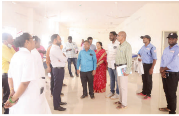
యని వాటిని వినియోగించుకోవాలని తెలియజేశారు. ఆసుపత్రిలో పరిశుభ్రతను పరిశీలిస్తూ పద్ధతి పాటించాలన్నారు చిన్నచిన్న మరమ్మత్తులను చేపట్టే రోగులకు సౌకర్యాలను మెరుగుపరచాలన్నారు. కలెక్టర్ వెంట జిల్లా