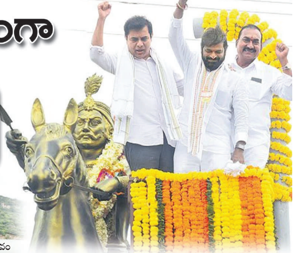
రాజన్న సిరిసిల్ల, ఆగస్టు 18 (మనం న్యూస్):

కేసీఆర్ చేతుల మీదుగా మల్కపేట జలాశయ ప్రారంభోత్సవం మానేరు బ్రిడ్జిలో బోటు షివారు ప్రారంభించిన కేటీఆర్ సర్వాయి పాపన్న గౌడ్ని ఆత్మ గౌరవ పోరాటం ఆయన స్ఫూర్తితోనే కేసీఆర్ గోల్కొండపై జెండా ఎగరేశారు బీఆర్ఎస్ సీదల సర్కార్ : కేటీఆర్ కేసీఆర్తోనే అన్నివర్గాలకు న్యాయం సిరిసిల్ల అంటేనే నేతన్న, గీతన్న గౌడ్లకు సెస్టి మోకాలు అందిస్తాం: సిరిసిల్లలో మంత్రి కేటీఆర్