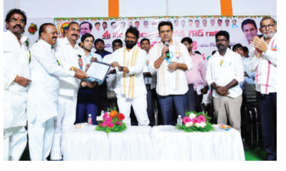
నుంచి ప్రానియర్ల వహించడం ఈ ప్రాంత ప్రజల అభ్యుత్థమన్నారు. సిరిసిల్ల అంటే ఇక్కడి ప్రజలకు రాష్ట్రంలో ఎక్కడికీ వెళ్లినా గౌరవం ఉంటుందని, కుల మత బేదం లేకుండా అన్ని వర్గాల అభ్యుత్థానికి కేసీఆర్ ప్రభుత్వం కృషి చేస్తుందన్నారు. సెట్ల మోకాలు త్వరలోనే అందజేస్తున్నారన్నారు. ట్యాంక్ బండ్ పై రూ.8కోట్లతో సర్దార్ సర్వాయి పాపన్న గౌడ్ నిలువెత్తు విగ్రహాన్ని ప్రతిష్ఠిస్తున్నారన్నారు. సర్వాయి పాపన్నగౌడ్ వారసులుగా మేలు చేసిన వ్యక్తుల వెన్నులో ఉంటామన్నారు. కులవృత్తుల అందరి డీఎంపీ ఒక్కటేనని, రాబోయే మూడేళ్లలో సీనియరు అన్ని తెలంగాణ ప్రజల్లోనే తీస్తారన్నారు. ఆధ్యాత్మికత, ధారణానికీ తెలంగాణ కేంద్రం బిందువు కానుందన్నారు. గౌడ జాతికి ఇప్పటికీ సీఎం కేటీఆర్ ఎంతో చేశారన్నారు. భవిష్యత్లో మరెంతో చేస్తారని, ఎంతో మేలు చేసిన ప్రభుత్వానికి గౌడనులు అందగా ఉండాలన్నారు.

లాలు జూనియర్ కళాశాలలుగా అప్గ్రేడ్ అయ్యాయన్నారు. రాజన్న సిరిసిల్లలోనూ సీరా కేఫ్ ఏర్పాటు చేస్తున్నారన్నారు. సిరిసిల్ల అంటేనే నేతన్న, గీతన్న అని.. ఇద్దరికీ అవినావభావం సంబంధం ఉందని మంత్రి శ్రీనివాస్ గౌడ్ అన్నారు. సమైక్య రాష్ట్రంలో నేత, గీత కార్మికులు అష్టకష్టాలు పడక నాటి ప్రభుత్వాలు పట్టించుకోలేదన్నారు. నాగరికత నేర్పిన వృత్తులు, కుల వృత్తులు స్వరాష్ట్రం తెలంగాణలో కులవృత్తులకు పూర్ణవైభవం వచ్చిందన్నారు. సిరిసిల్లలో సర్వాయిపాపన్న విగ్రహవిష్కరణలో మంత్రి కేటీఆర్తో కలిసి పాల్గొన్నారు. అనంతరం జరిగిన సమావేశంలో పాల్గొని మాట్లాడారు. కల్లూలో అనేక ఔషధాలు ఉన్నాయని, అందుకే అమ్మతం అంటారన్నారు. అనేక చొట్ల రెండు గ్లాసెల్ విధానం ఉన్నా.. కల్లు కాంపౌండ్లో రెండు గ్లాసెల్ పద్ధతి ఉండేది కాదన్నారు. గౌడ కులస్తులు తమ వృత్తుల గౌరవించాలని, సీఎం కేటీఆర్ అన్ని కులవృత్తులకు సమాన గౌరవం ఇచ్చి అదరించారన్నారు. హైదరాబాద్లో సీరాను విక్రయించేందుకు సీరా కేఫ్ ఏర్పాటు చేశామని, బెంజ్ కార్లో వచ్చి దునికులు కూడా కేఫ్లో సీరా తాగుతున్నారన్నారు. 70వేల గీత కార్మికులకు ప్రభుత్వం పెన్షన్ ఇస్తుందని, వైసీపీలో 15శాతం రిజిస్ట్రేషన్లు కేటాయించారని, సమైక్య రాష్ట్రంలో జానుడు జాగా అడిగితే రూల్స్ చెప్పారని, ఇప్పుడు అన్ని కులాలకు విలువైన జాగాలు ఇచ్చారన్నారు. కేటీఆర్ ఇక్కడి