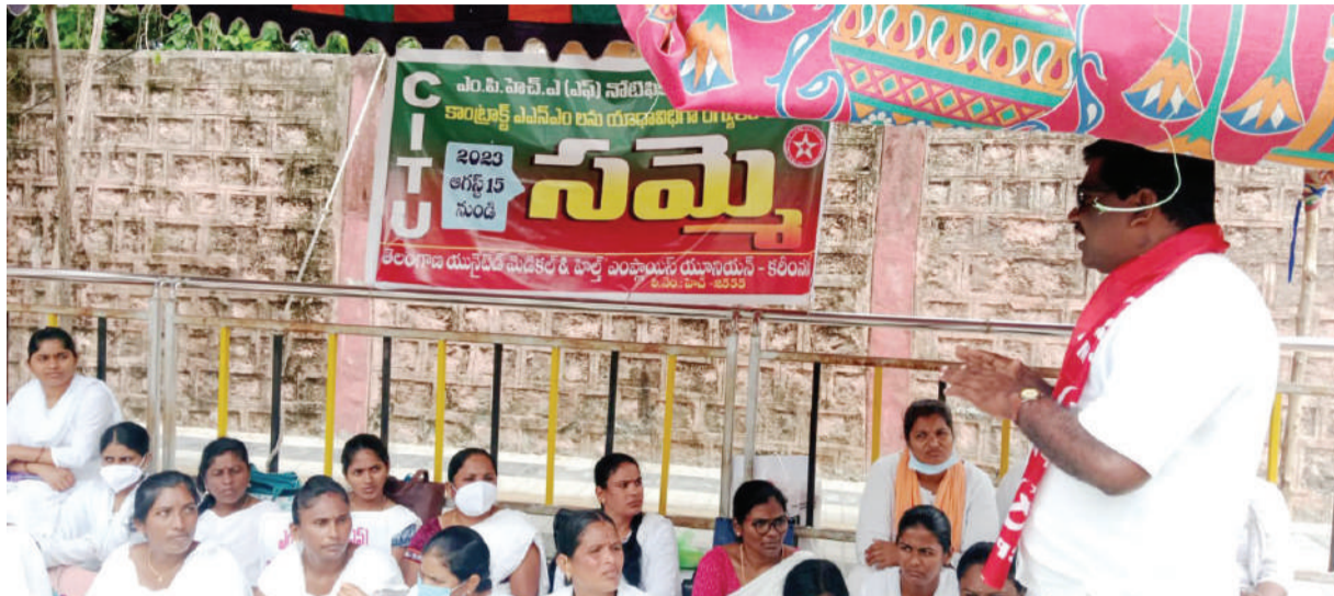
కాంట్రాక్టు, అవుట్ సోనింగ్, డైలీ వైని ఉద్యోగాలు ఉండవని సుప్రీంకోర్టు ప్రకటించిన హామీని నిలబెట్టుకోవాలని డిమాండ్ చేశారు. ఎఎన్ఎంలకు సమస్యల పట్ల సానుకూల దృక్పథంతో ఆలోచించి సమస్యలు పరిష్కారం చేయాలని డిమాండ్ చేశారు.