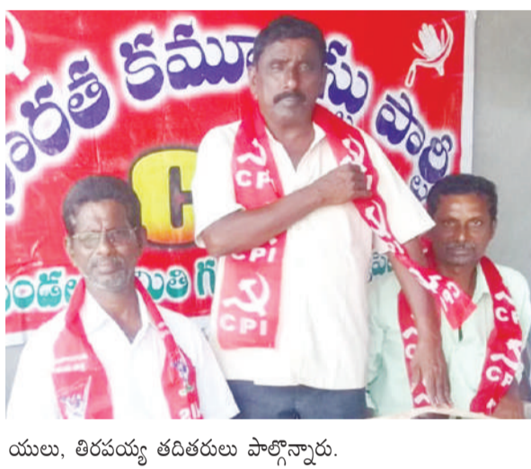
యలు, తిరుమలగిరి తదితరులు పాల్గొన్నారు.