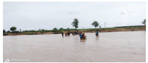
యే పిల్లలు ఇంటి వద్దనే ఉంటున్నారు. సీజనల్ వ్యాధులు వ్యాపించే ఆవకాశం ఉండడంతో అత్యవసరమైతే పరిస్థితి ఏంటి అని ప్రజలు మదన పడుతున్నారు. ఉన్నతాధికారులు సర్పంచలు స్పందించి రాకపోకలు జరిగే విధంగా చూడాలని ప్రజలు వేడుకుంటున్నారు.