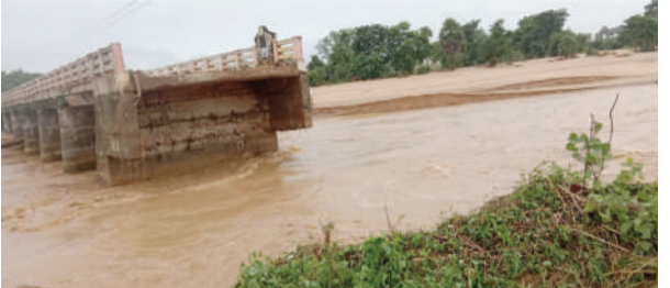
ఐం అంటే సాహసంతో కూడిన యాత్ర అని ప్రజలు చెప్పుకుంటున్నారు. వరాలు తగ్గి నాలుగు రోజులు గడుస్తున్నా మరమ్మతులు చేపట్టకపోవడంతో ప్రజలు భయాందోళన గురవుతున్నారు.

● తీవ్ర ఇబ్బందులు ఎదుర్కొంటున్న 8 గ్రామాల ప్రజలు.. కరకగూడెం, జూలై 31(మనం న్యూస్): భారీ వర్షాలకు కరకగూడెం మండల పరిధిలోని పెద్దపాగుస్సు నిర్మించిన బ్రిడ్జి ముందుభాగం 45 అడుగులకు కొతకు గురై ప్రధాన రహదారి పూర్తిగా కొట్టకపోయింది. దీంతో వట్టం వారి గుంపు గ్రామపంచాయతీ సీరమళ్ళ గ్రామపంచాయతీలో గల ఎనిమిది గ్రామాల ప్రజలు రాకపోకలు నిలిచిపోవడంతో తీవ్ర ఇబ్బందులు ఎదుర్కొంటున్నారు. కరకగూడెం ప్రధాన కేంద్రంగా నిత్యవసర వస్తువులు వ్యవసాయ ఆదారిత వస్తువులు ట్రాక్టర్లు జెసిపి లు తదితర వాహనాలు రాక ప్రజలు అవస్థలు పడుతున్నారు. బ్యాంకు కు వెళ్లాలన్న వాగులో మోకాళ్ళ బంటి నీటిలో దాటవలసి వస్తుంది. అత్యవసరమైతే ప్రాణాలు పోయే పరిస్థితి ఏర్పడుతుంది. రాత్రి ప్రయాణం అంటే సాహసంతో కూడిన యాత్ర అని ప్రజలు చెప్పుకుంటున్నారు. వరాలు తగ్గి నాలుగు రోజులు గడుస్తున్నా మరమ్మతులు చేపట్టకపోవడంతో ప్రజలు భయాందోళన గురవుతున్నారు. చిన్నపిల్లలు, బాలింతలు వారు దాటాలంటే భయపడుతున్నారు. పైవేలే బడుగులకు పో