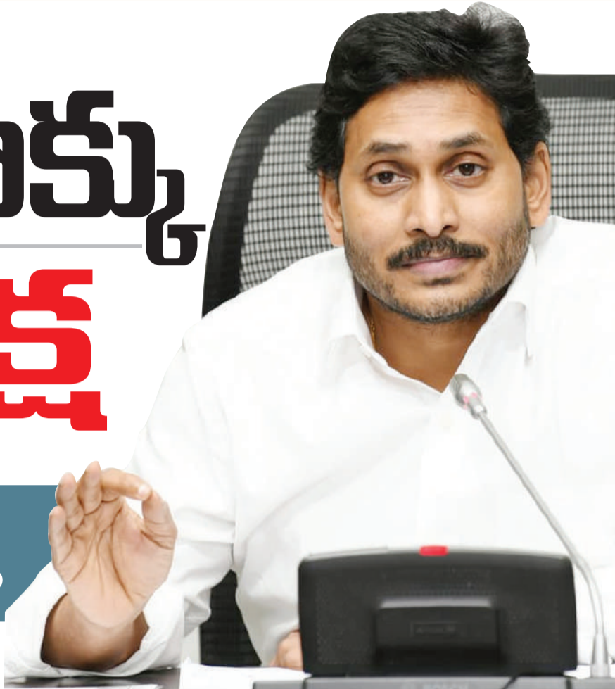
అమరావతి, జూలై 31 (మనం న్యూస్):