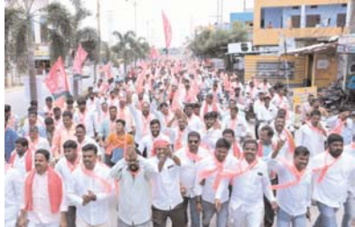
యాదగిరిగుట్ట ,ఆగస్టు 28 (మనం స్టూన్):

ఘన నిరాజనం పట్టారు. బీఆర్ఎస్ శ్రేణులు బైక్ ర్యాలీ నిర్వహించారు.