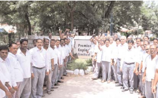
ఇస్రో తమకు కావాలని చెప్పగా మూడు బూస్టర్లను తయారు చేశామని తెలిపారు. దేశానికి గర్వకారణంగా నిలిచే ఇస్రో శాస్త్రవేత్తలకు మా కంపెనీ తయారు చేసేటటుంటి పరికరాలకు ఉద్యోగుల కృషి ఎంతో ఉందని తెలిపారు.

మేరకు తమ ఉద్యోగులను వారిని శ్రీహరికోటలో చేర్చామన్నారు. చంద్రయాన్ 3 మిషన్ విజయవంతం కావడానికి తమ ఉద్యోగుల గర్వ కారణం అన్నారు.. కాటేపల్లి లో పిఎస్ ఎల్ వి బూస్టర్ తయారీ..... ఇస్రో నుండి వచ్చిన రిక్రూట్మెంట్ మేరకు మూటకొండూర్ మండలం కాటేపల్లిటి గ్రామంలో ఉన్న ప్రీమియర్ ఎక్స్ క్లూజివ్ కంపెనీ టూ లో పిఎస్ఎల్వి బూస్టర్ల తయారీ చేస్తున్నామని ప్రీమియర్ ఎక్స్ క్లూజివ్ లిమిటెడ్ కంపెనీ సంస్థ యాజమాన్యం తెలిపింది. దీనిలో భాగంగా నెల శ్రీతం 6 పిఎస్ఎల్వి బూస్టర్లను