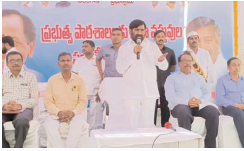
క్రీడలతోనే లభిస్తుందని చిన్న వయసునుండి క్రీడా స్పృహని పెంచడమే లక్ష్యంగా పని చేయాలని... 4 తో...