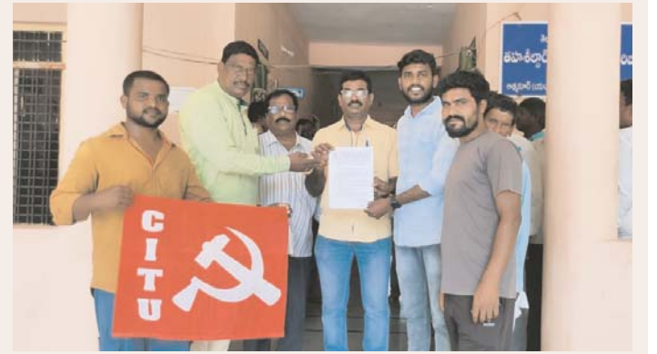
అత్యుక్త(ఎం), ఆగస్టు 11 (మనం న్యూస్):