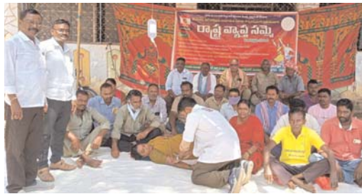
హజూర్ నగర్, ఆగస్టు 5, మనం న్యూస్: