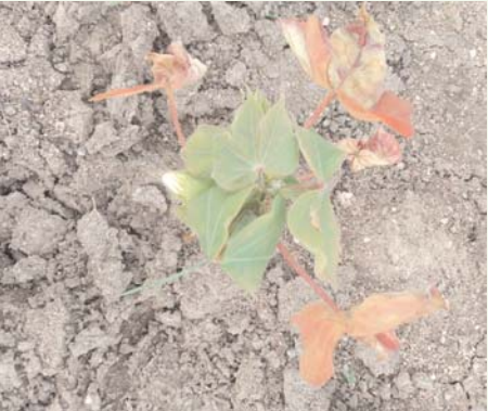
ఒకటి రెండు ఒకటికి రెండు సార్లు విత్తనాలు రైతులు వేయాల్సి వచ్చింది.

నల్గొండ, ఆగస్టు 3 (మనం ప్రతినీధి) : తెలంగాణ రాష్ట్రం (పత్తి) సాగు చేస్తున్న రైతులకు అవస్థలు తప్పడం లేదు. ఈ సంవత్సరం అయినా కాలం మంచిగా అయితే తమ కష్టాలు తీరుతాయని రైతులు భావించారు. నల్గొండ జిల్లాలో 32 మండలాలు ఉండగా సగం మండలంలో ప్రతి అధికంగా పండిస్తున్నారు. సాగర్ ఆయకట్టు పరిధిలో ఉన్న మండలాల్లో వరి ఎక్కువగా పండిస్తున్నారు. నాన్ ఆయకట్టు ప్రాంతాల్లో ఎక్కువగా పత్తిని జిల్లాలో పండిస్తున్నారు. జిల్లాలోని వ, య, న, య, గో, డ, య, గ, ట, ట్, ట, ట, చందూరు, ముద్రిగూడెం, నాంపల్లి, నల్గొండ, కనగల్ తిప్పర్తి పీఠ పల్లి, చిట్యాల, నార్కట్ పల్లి, కట్టంగూర్, డిండి చింతపల్లి, చందంపేట దేవకొండ మండలాల్లోని వివిధ గ్రామాల్లో అధికంగా పత్తిని పండిస్తున్నారు. ప్రతి అధికంగా పండించే ప్రాంతాల్లోనే పత్తిని కొనుగోలు చేయడానికి పత్తి మిల్లలను వివిధ కంపెనీల వారు ఏర్పాటు చేశారు. ఈ సంవత్సరం నల్గొండ జిల్లాలో 5.86 లక్షల ఎకరాలు పత్తిని సాగు చేస్తున్నారని వ్యవసాయ శాఖ వారు తెలిపారు. గత నెలలో కురిసిన వర్షాల వల్ల వారిని అగ్రగామిగా ఉన్న ప్రతి పంట భారీ వర్షాలతో కొన్ని ప్రాంతాల్లో దెబ్బతిన్నది. గత సంవత్సరం జిల్లాలో అతివృష్టితో లక్షల ఎకరాల్లో పత్తి పంట దెబ్బతిన్నది. గత సంవత్సరం పత్తి పంటకు 7500 నుండి 8500 వరకు అమ్మాయి పోయింది.